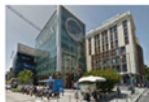
Impermeabilizzanti Triflex per corso