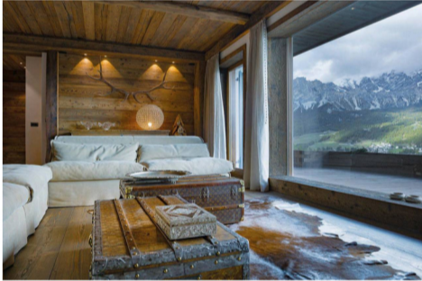
Residenza alpina a Cortina d'Ampezzo

Le ampie vetrate che incorniciano le vette dolomitiche e rivelano l'incantevole panorama della conca ampezzana inondano di luce la zona giorno, garantendo un'illuminazione naturale, riscaldata anche da un sistema di illuminazioni di produzione artigianale. Ed è lì, tra il legno di larice antico che avvolge sagome moderne e ricercate in modo straordinariamente elegante, che i dettagli della tradizione si scontrano piacevolmente con i materiali plastici della contemporaneità, dettando un riuscito connubio tra lo stile alpino e le avanguardiste e materiche configurazioni dell'interior design.