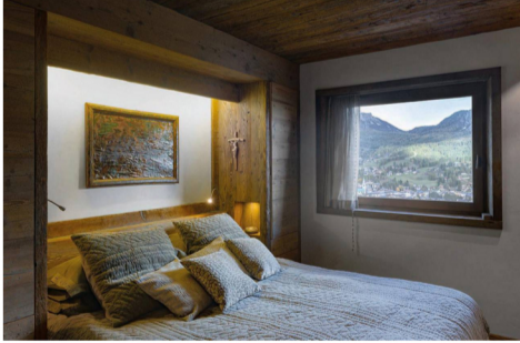
Residenza alpina a Cortina d'Ampezzo

Lo spazio aperto si apre poi sulla sala da pranzo dominata dall'importante tavolo realizzato con un unico piano di legno massiccio antico, di recupero dalla pavimentazione di un vecchio fienile, sorretto da due lastre vitree e che ben si accosta alle delicate sedie in plexiglass. Di nuovo l'attenzione scrupolosa al dettaglio colpisce e attrae, come per l'elegante candelabro in argento che riproduce le corna di cervo, un maestoso ornamento in perfetta sintonia con lo stile tradizionalmente alpino di Cortina, mentre la cucina, in legno di larice antico, evidenzia un piacevole contrasto di superfici tra legno, acciaio e resina.