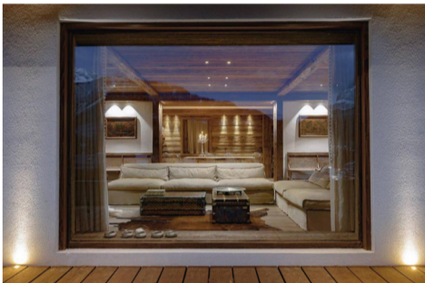
Residenza alpina a Cortina d'Ampezzo