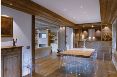
Residenza alpina a Cortina d'Ampezzo

Tra i morbidi divani in pelle ammicca un ritorno alla moda degli anni '70 con i preziosi bauli griffati Louis Vuitton e i tappeti in pelle, mentre un palco di cervo ricorda l'ubicazione alpina della dimora. Il romantico caminetto custodito nella boiserie in legno della parete completa l'atmosfera accogliente e calorosa tipica di una casa di montagna, affiancato da una libreria e un innovativo dettaglio dedicato alla tecnologia.